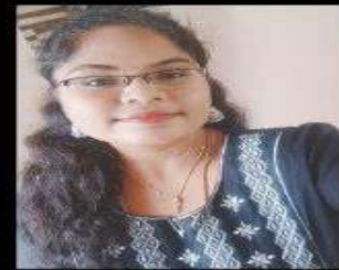
Name - Mehalar State - Tamilnadu Selected as - IBPS Clerk