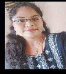
Name - Mehalar State - Tamilnadu Selected as - IBPS Clerk