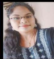
Name - Mehalar State - Tamilnadu Selected as - IBPS Clerk