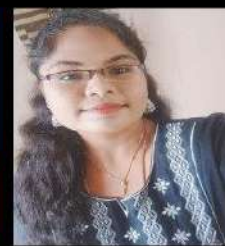
Name - Mehalar State - Tamilnadu Selected as - IBPS Clerk